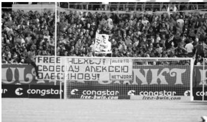
Ultras Sankt Pauli fordern die Freilassung des Moskauer Antifaschisten Shkobar, April 2009

Die Reaktion der ukrainischen Politik und der Massenmedien ist skandalös: Präsident Juschenko hat am 22. April 2009 die Selbstverteidigung der Antifaschisten in Odessa