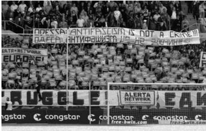
Ultras Sankt Pauli zeigen ihre Solidarität mit den AntifaschistInnen in der Ukraine, April 2009

als gezielten Mord verurteilt, obwohl sich die polizeilichen Ermittlungen noch in der Anfangsphase befanden, und Polizei und Staatsschutz aufgefordert, gegen die "anti-ukrainischen Extremisten der Organisation 'Antifa'" härter vorzugehen und nach den politischen