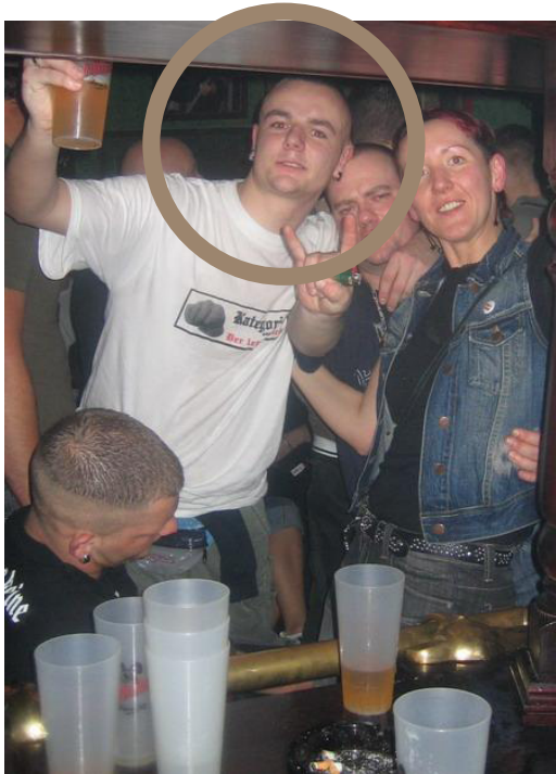
Pankower NPD-Aktivist mit „Kategorie C“-Shirt am 8. Februar 2008 im Neffen und Nichten